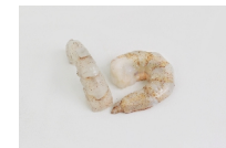
Pelado sin vena (halada)