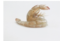
Cola de fácil pelado (Ezpeel)