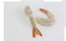
Pelado y desvenado, con cola